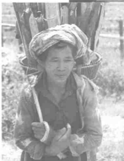
Penduduk Peribumi Walaupun Penduduk Labuan