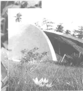
Tugu Peringatan Perang Dunia Kedua, di Labuan

Walaupun tidak banyak tempat menarik jika dibandingkan dengan Kuala Lumpur, Pulau Labuan adalah sebuah pelabuhan bebas cukai dan popular sebagai destinasi membeli-belah. Antara tempat yang boleh dilawati di Labuan ialah Taman Binatang dan Tugu Peringatan Perang Dunia Kedua. Satu lagi yang menjadi tarikan di Labuan adalah bangunan Masjid Labuan yang begitu indah dan unik.