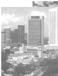
Beberapa bangunan moden di Kuala Lumpur

damai. Terdapat banyak tempat menarik yang boleh dikunjungi. Jika hendak dibandingkan dengan keluasanya yang hanya 243.65 kilometer persegi, ternyata kawasan sekecil ini mempunyai bilangan tempat-tempat menarik yang paling banyak dan merata.