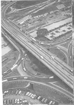
Jalan raya di Malaysia

berdiri di tengah-tengah Bandaraya Kuala Lumpur sebagai lambang kemegahan negara Malaysia yang sedang pesat membangun. Jalan raya dan lebuhraya yang menghubungkan Kuala Lumpur dengan kawasan-kawasan lain, bersimpang-siur dengan kenderaan yang tidak putus-putus. Kesyakan lalu-lintas adalah menjadi perkara biasa kepada penduduk Kuala Lumpur yang bilangannya melebihi sejuta orang. Jalan raya sentiasa dilebarkan dan diperbaiki untuk menampung kesesakan ini.