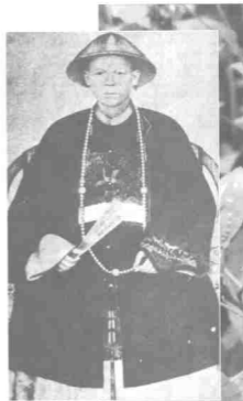
Yap Ah Loy